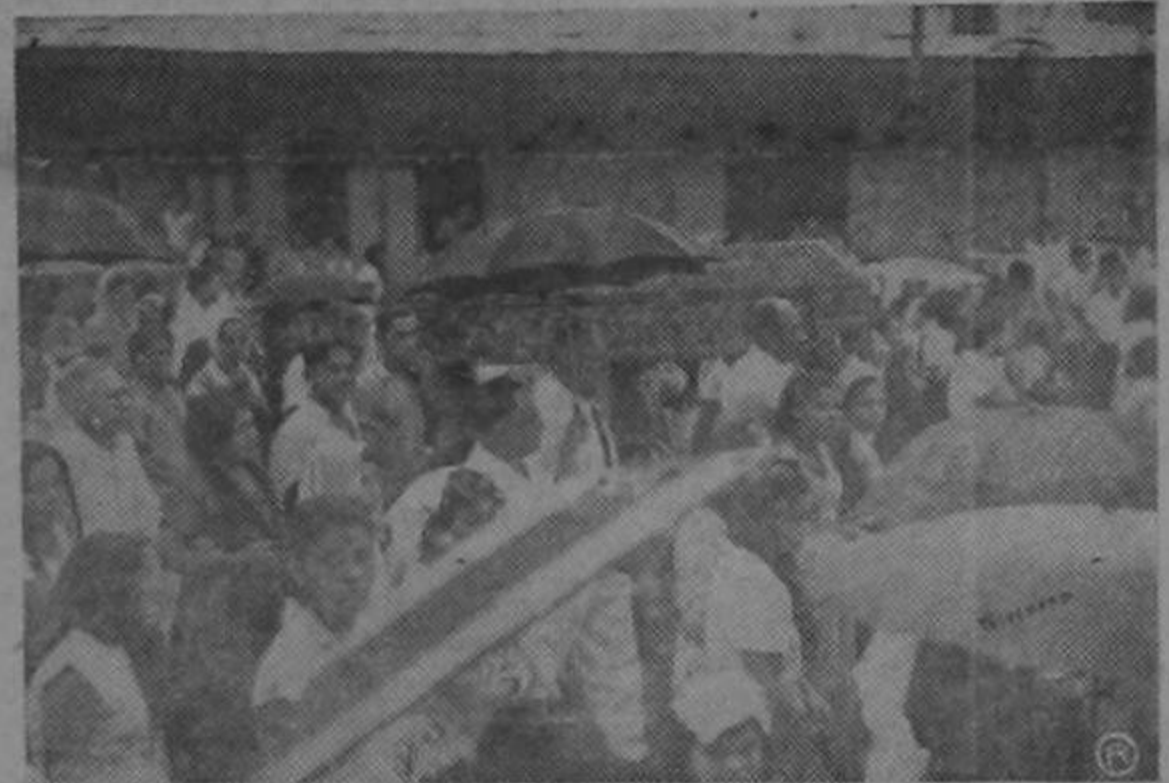
El féretro que conduce los restos mortales del llorado Padre Francisco Acosta, es llevado en hombros de los fieles, rasta la Santa Iglesia Catedral, donde fué velado la noche del martes 13. Puede apreciarse en primer término al señor Gobernador de la Provincia, Don Franklin Venegas.